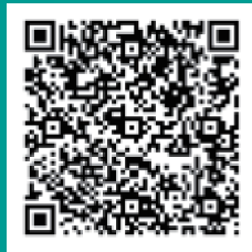
大学生书友 志愿者服务队 QQ