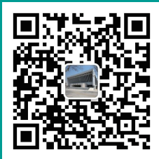
图书馆 官方微信公众号